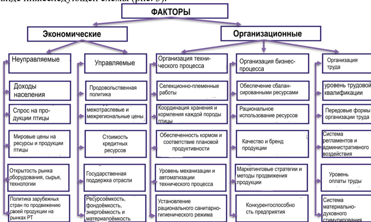
Рисунок 3 . Факторы эффективности производства продукции птицеводства

Исходя из этого, в диссертации были классифицированы факторы, влияющие на конечную эффективность и результативность птицеводческого производства в виде нижеследующей схемы (рис. 3).