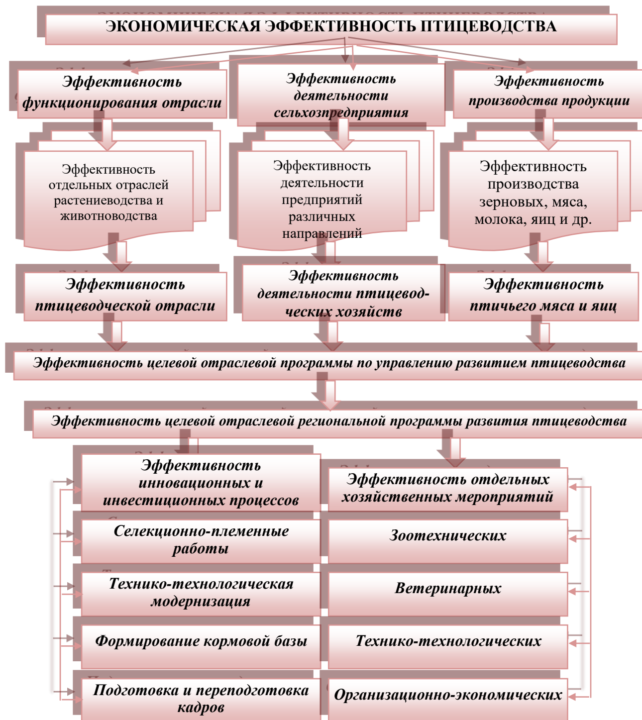
Рисунок 1 . Экономическая эффективность птицеводства