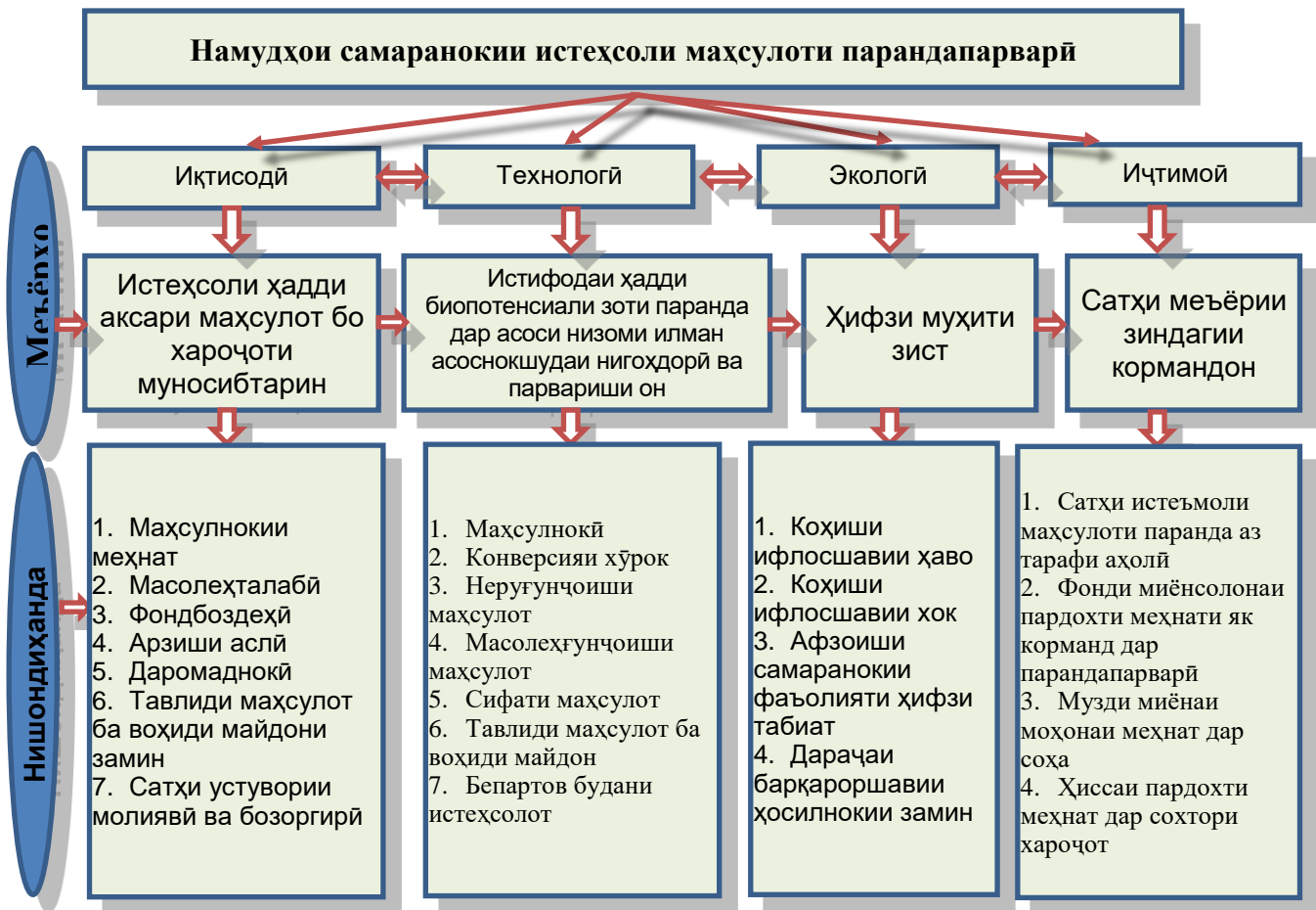
Расми 2. Равиши комплексӣ барои арзёбии самаранокии истеҳсоли парандапарварӣ