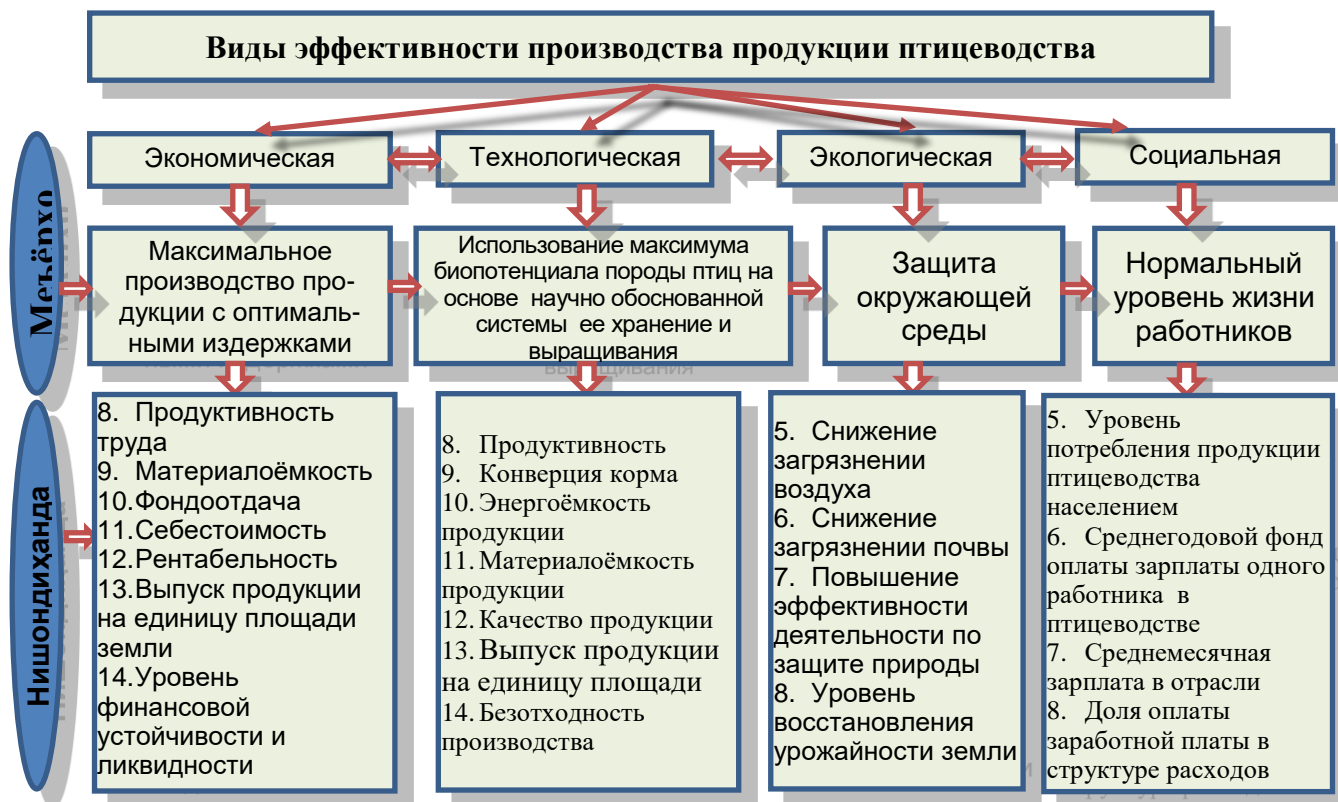
Рисунок 2. Комплексный подход к оценке эффективности птицеводства