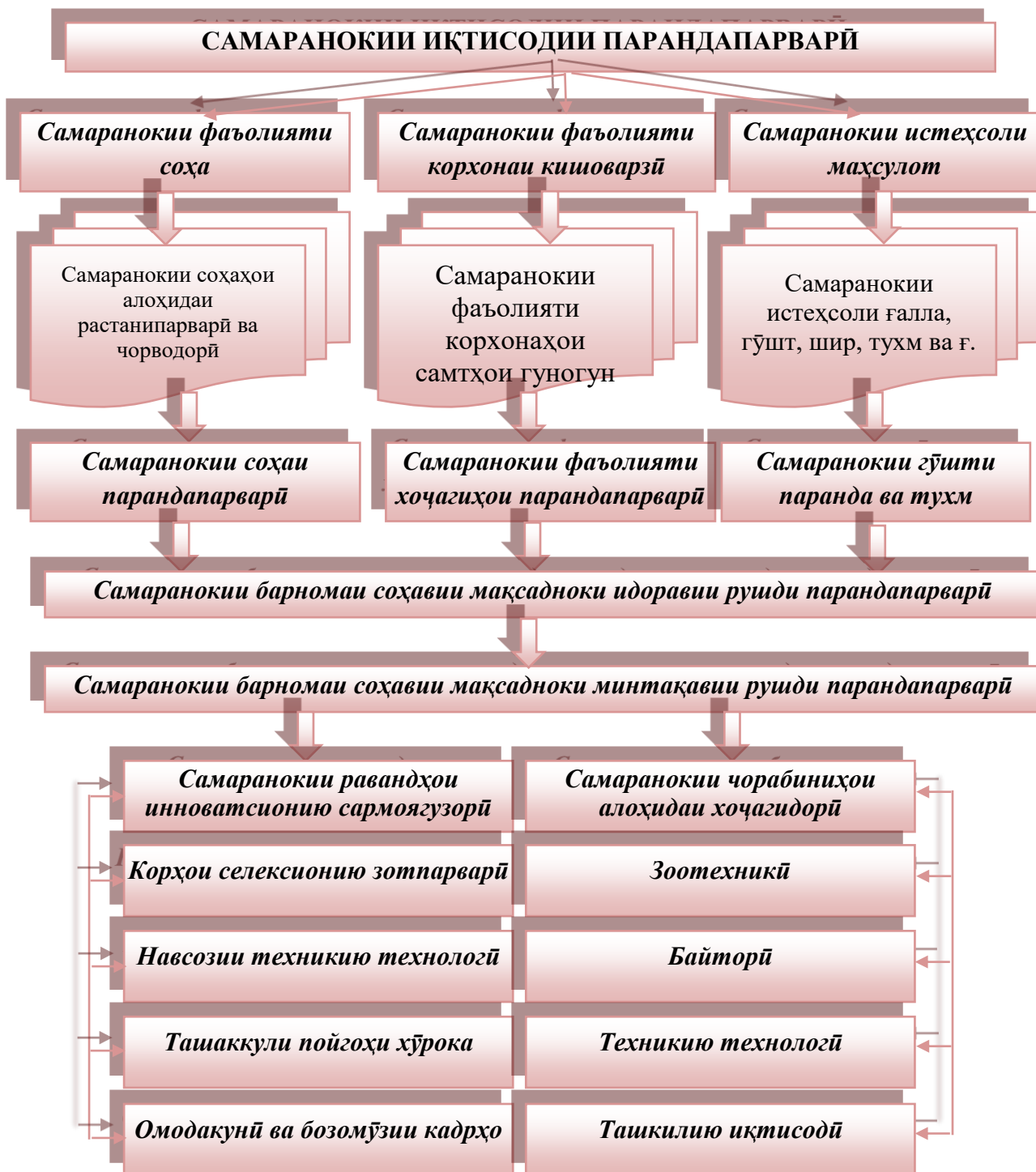
Расми 1. Самаранокии иқтисодии парандапарварӣ

(самаранокии фаъолият) ва дар сатҳи маҳсулоти соҳа (самаранокии маҳсулот). Дар баробари ин ҳар кадоми онҳоро асоснок кардан лозим аст (расми 1)..